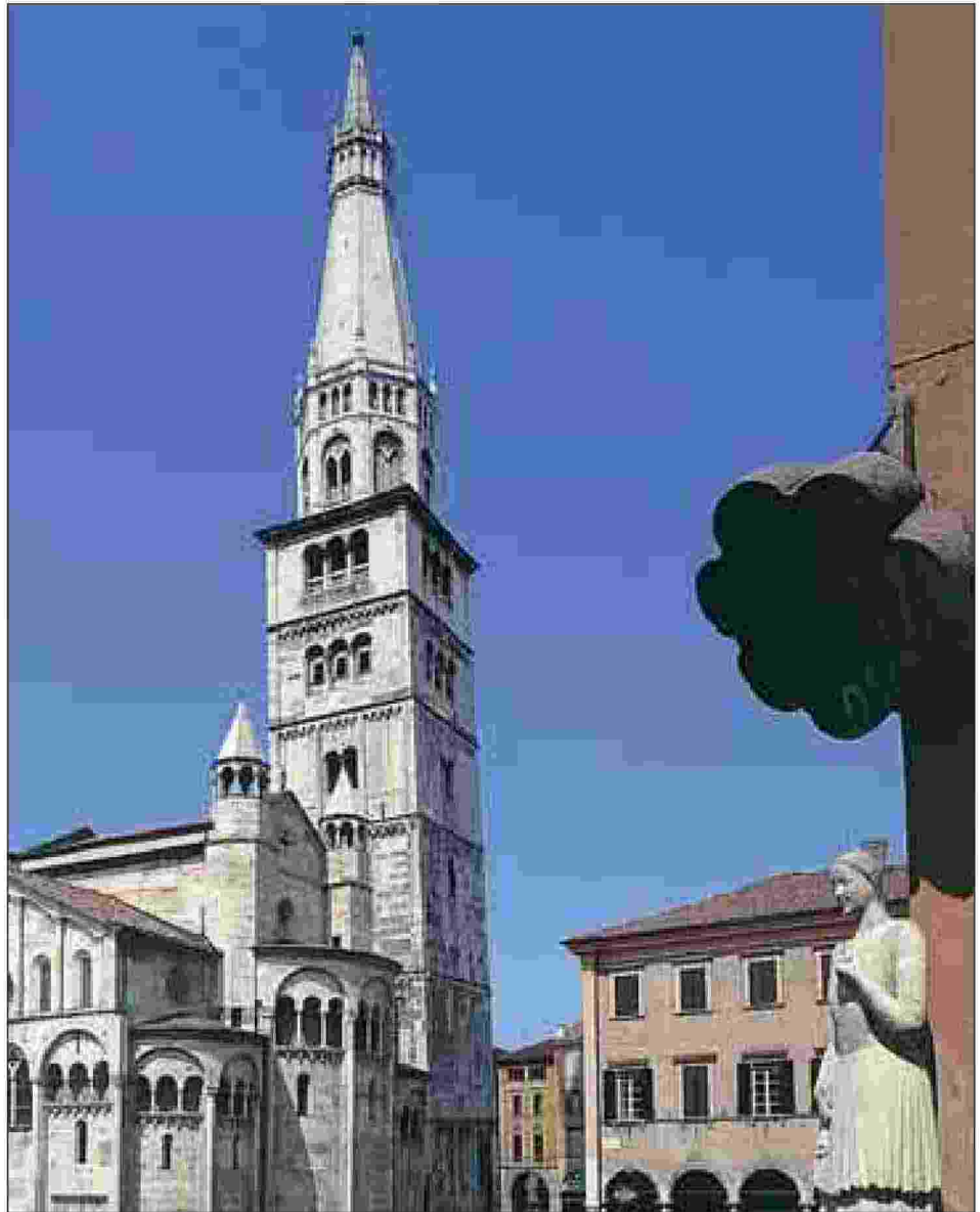
La Ghirlandina, monumento storico di Modena

La quindicesima edizione della kermesse prevede lezioni magistrali, mostre, spettacoli, letture, giochi per bambini e cene filosofiche